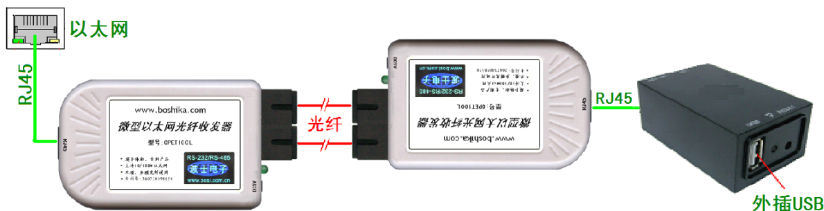
图 1： OPET-USB 全套产品