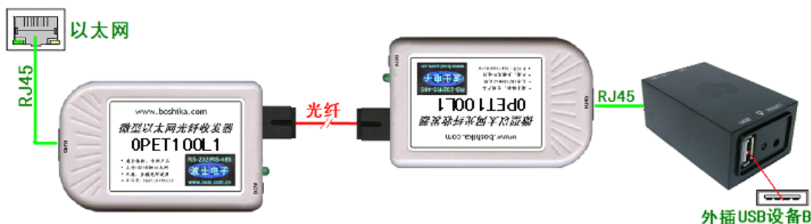
图 3： 使用 OPET100L1 的单纤 OPET-USB1 全套产品

将 2 个 OPET100L 改为一对 OPET100L1 可以实现用一根光纤延长 USB 的功能。